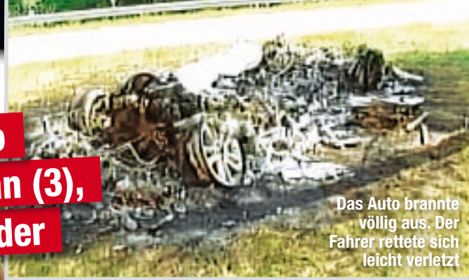
Das Auto brannte völlig aus. Der Fahrer rettete sich leicht verletzt

In diesem Auto starben Sohn (3), Mann und Bruder